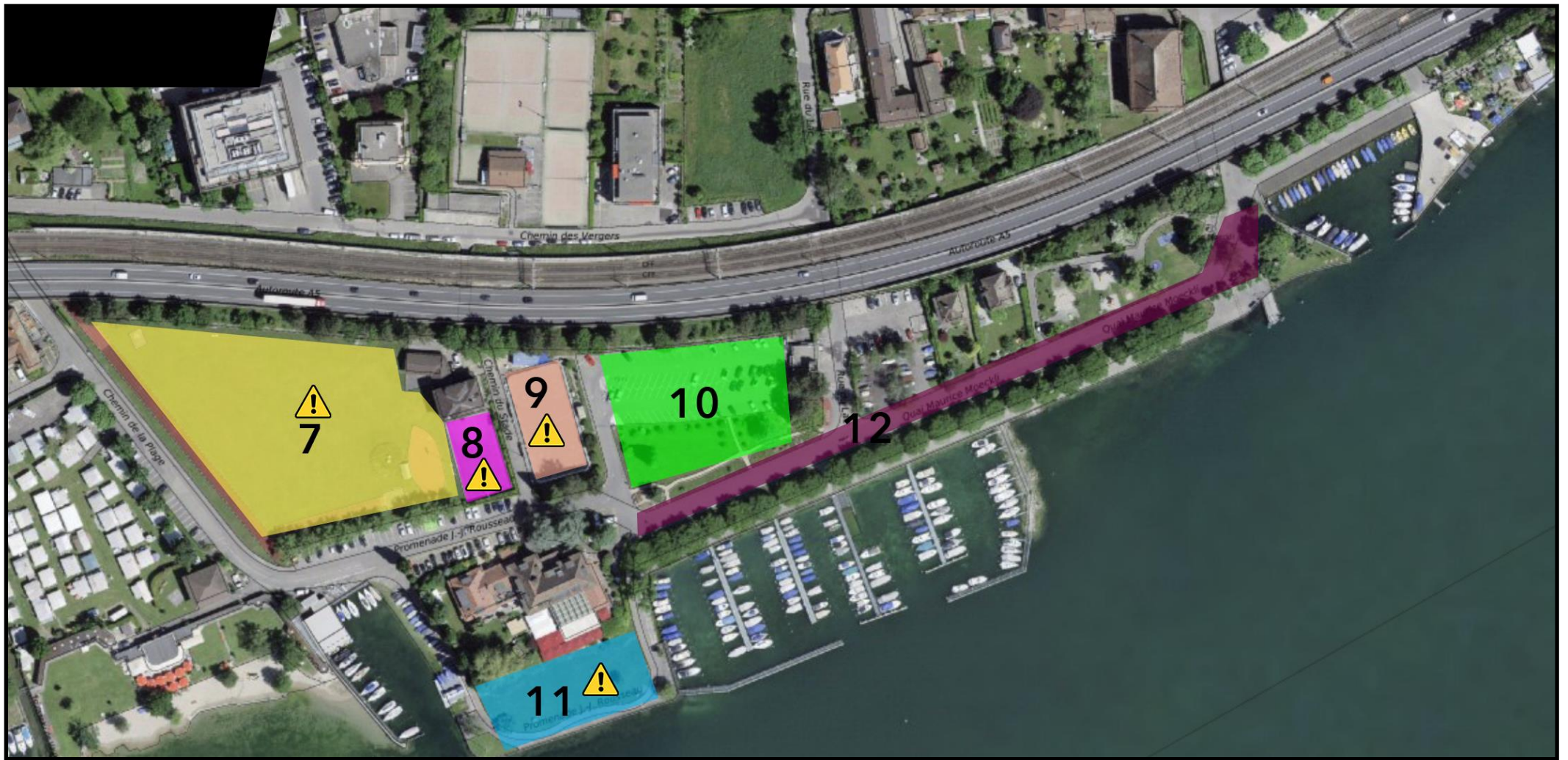
Zone 3 - Bord du Lac Ouest