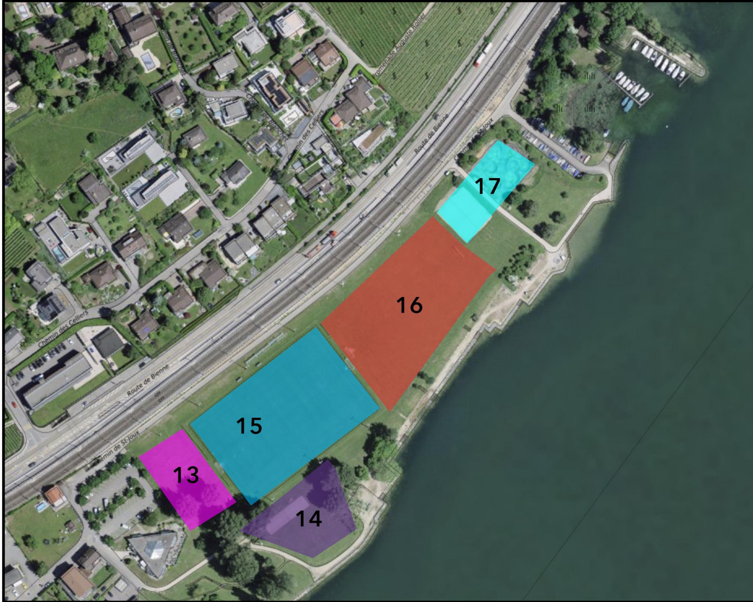
Zone 4 - St-Joux