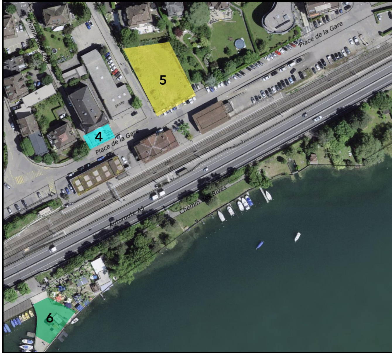
Zone 2 - Gare et Buvette