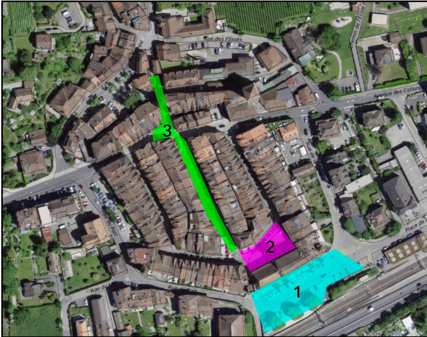
Zone 1 - Vieille Ville